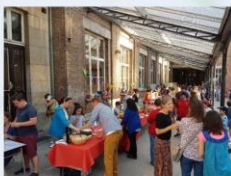
APéro Tour du Monde