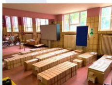
Kits de fournitures