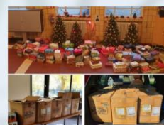
Efforts Avent et Carême